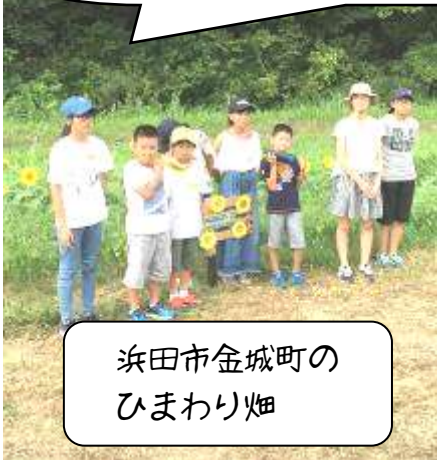
浜田市金城町の ひまわり畑