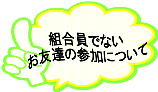
やまびこ会のみなさん