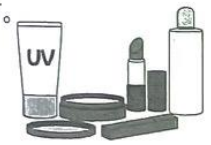
日焼け止めクリーム・化粧品