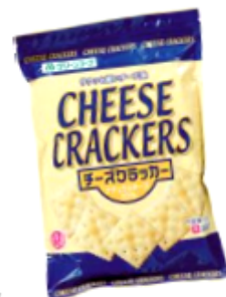
GCチーズクラッカー