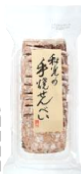
しょうがせんべい (和光の手焼せんべい)

・暑い時は味噌汁より、さっぱりしたすまし汁が美味しい。このかつおだしに少しの醤油とみりんを入れるだけで簡単に味が決まります。 ・コンソメスープの時に隠し味にします。 ・かつおだしに天然塩と醤油だけで夏はあっさりすまし汁が美味しい。 ※ 乾燥わかめをいれても! ※ 梅干しをたたいてペーストにしてお椀に入れ、白髪ねぎを入れたところにだしを注ぎ、刻み海苔を散らした「海苔吸い」もおすすりめ♪